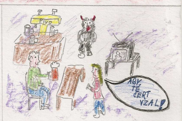
Chalupník se hádá se svoji ženou