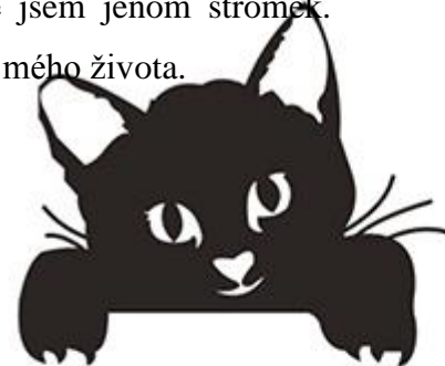
Matěj Strejc 7.A